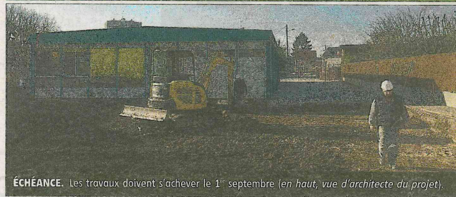
ÉCHÉANCE. Les travaux doivent s'achever le 1 er septembre (en haut, vue d'architecte du projet).