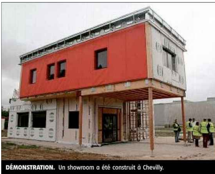
DÉMONSTRATION. Un showroom a été construit à Chevilly.