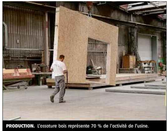
PRODUCTION. L'ossature bois représente 70 % de l'activité de l'usine.