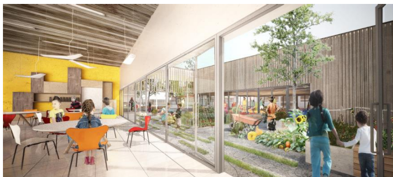
Vue depuis la salle à manger maternelle ©AKLA Architectes

Dans un but d'éducation environnementale, des potagers pédagogiques seront créés dans chaque cour. Les eaux de pluie des auvents seront récoltées dans une cuve pour servir d'arrosage à ces potagers.