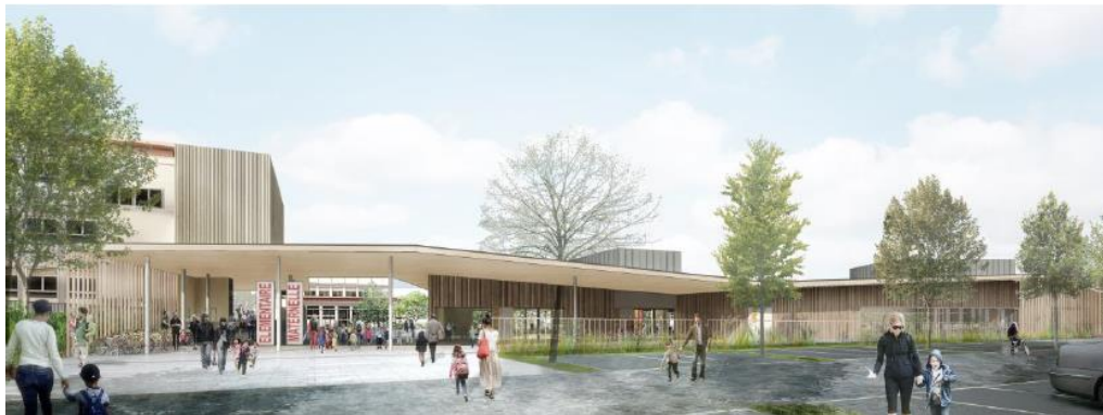
Vue depuis le nouveau parvis © Akla Architectes

Ce chantier repose sur la grande expérience d'OBM Construction à travailler en site occupé, en générant de faibles nuisances et en respectant des délais courts, grâce au choix d'une mixité des matériaux bois/ métal. De plus, OBM Construction a pu y apporter tout sa technicité pour valoriser visuellement le CLT.